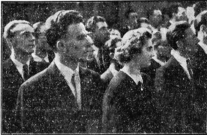
Az orvosjelöltek az eskütétel előtt.

Felemelő pillanat következett. Az orvosjelöltek bátran, önbizalommal telten mondták az eskü szövegét. „En... esküszöm, hogy a Magyar Népköztársaság alkotmányához és a dolgozó néphez hű leszek, orvosi hivatásomhoz mindenkor méltó magatartást tanusítok... Minden igyekezettel azon leszek, hogy működésemmel