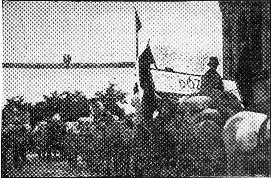
„AZ ELSŐ ZSÁK GABONÁT A HAZÁNAK!”