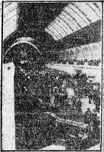
A képen: a mezőgazdaság gépesítésének és villamosításának pavilonjában.

A kiállítás résztvevőinek száma 168.999. Megosztásuk: 3911 kolhoz, 1306 szovhoz, 419 gépállomás és szakosított állomás, 3254 állattenyésztő telep, 196 kerület, 534 tudományos kutató és kísérleti intézmény, 134 tanintézet, iskola, az ifjú természetbarátok 2302 köre és telepe, 2027 más szervezet és intézmény, 454.916 élelmiszeripari mezőgazdasági dolgozó.