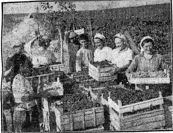
Szüret Varana község termelőszevetkezetében

Figyelememlétként azok a sikerek is, amelyeket Bulgária a népi kormányzat tíz esztendeje alatt a mezőgazdaságban aratott. Az 1944 szeptember 9-e előtti felaprózott, primitív mezőgazdaság átadta helyét a korszerű technikával felszerelt és a haladó agrártudomány minden eredményét felhasználó nagyüzemi, szövetkezeti gazdálkodásnak. A Bolgár Népköztársaság mezőgazdasági üzemének több, mint fele a megművelhető föld, több, mint 60 százalékkal termelősze- vetkezetekbe tömörült. Az új szövetkezeti mezőgazda- ság mind bőségesebben termel