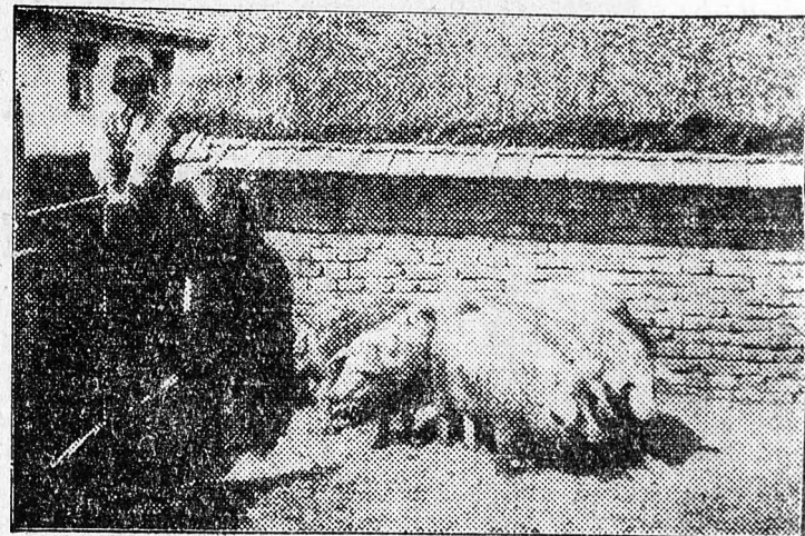
A debreceni gugyori Petőfi termelőszövetkezet hat mangalicásüldője, A 6 hónapos szép süldőket a mezőgazdasági kiállításon láthatják a látogatók