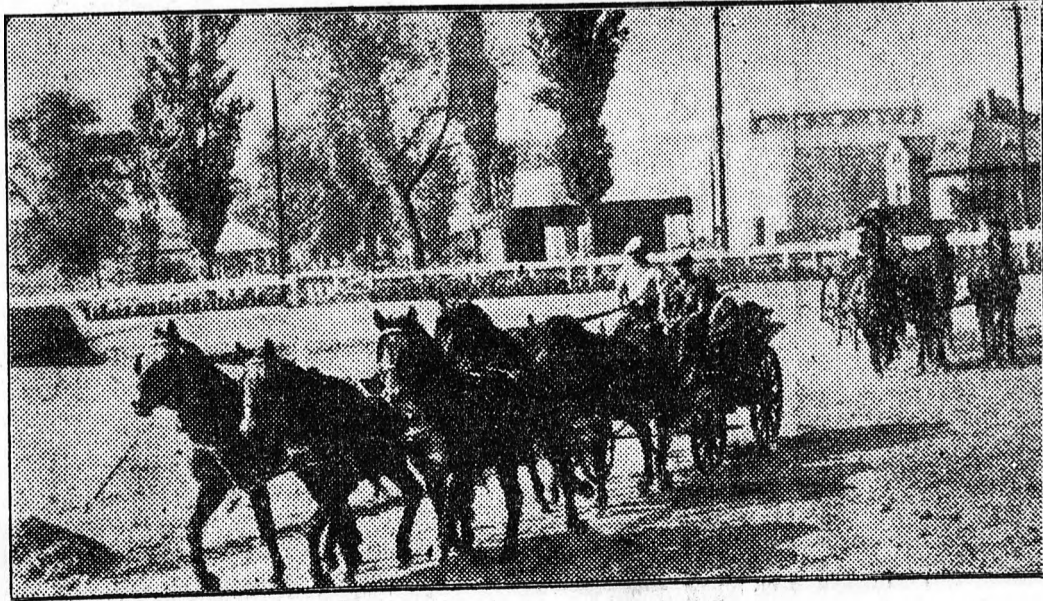
A híres ötösfogat — a debreceni méntelep büszkesége. Az öt fekete ló (a kép előterében) a kiállítás lovasbemutatóján Debrecen város régi koronázási hintójával szerepel.

Juhok díjazása: II. díjjal tüntették ki a balmazújvárosi Vörös Csillag tisz (anya) és II. díjjal a komádi Kossuth tisz juhat.