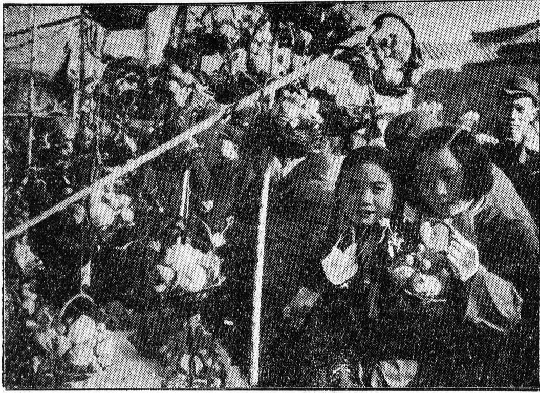
A pekingi híres Csung-tien piacon a gyermekek speciális pekingi gyártmányt, üvegből készült gyümölcsöket vásárolnak.