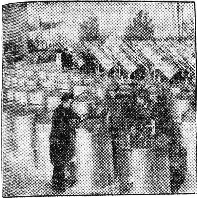
A lvovi mezőgazdasági gépgyár hordozható takarmányfűlesztőket készít az állattenyésztő farmok részére. Az üzem idén 15 ezer takarmányfűlesztőt gyárt a szovhozoknak és kolhozoknak. A képen: A lvovi mezőgazdasági gépgyár udvarán elszállításra várnak az új takarmányfűlesztők.