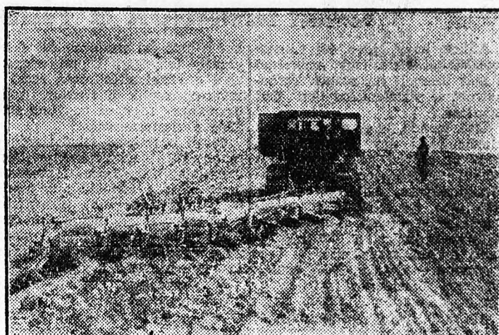
A Tadzsik SZSZK leninabadi kerületében fekvő „Andrejev” kolhoz földjein ötvású ekékkel végzik az őszi szántást.