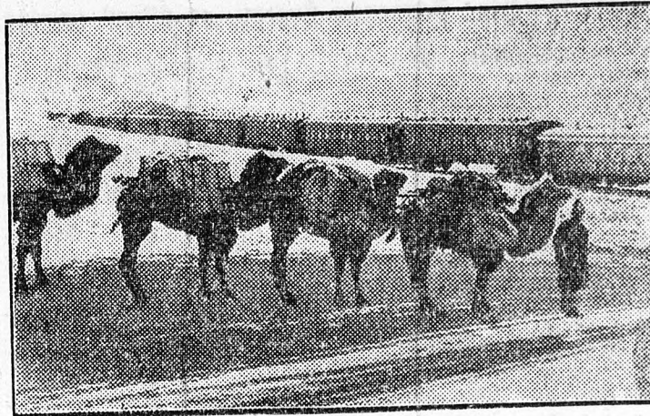
A múlt és jelen találkozása Szuhe-Bator mellett, az ulan-batori vasútvonal egyik átjárójánál.