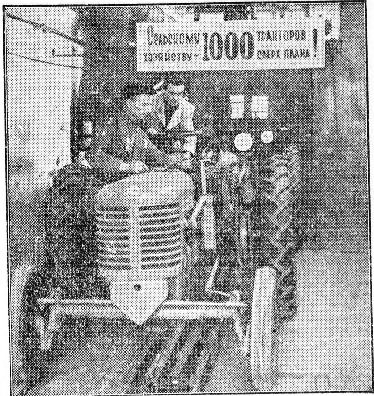
A harkovi traktorgyár kollektívája elhatározta, hogy 1954 végéig ezer HTZ-7 szántó-traktort gyárt terven felül. A gyár minden részlege jelentősen túlteljesítette tervét. — A képen: Egy tervfenfelül elkészült traktor a sok közül.

Tárgyalt a termelési bizottság arról is, hogy nehézséget okoz a géppálmással kötendő szerződéseknél az, hogy Hajdúdorogról Hajdúnánásra kell utazni. Felkéri a géppálmás igazgatóját, tegye lehetővé, hogy a géppálmás megbizottja egy-két napig Hajdúdorogon tartózkodjon, így utazgatás nélkül szerződést tudjanak majd kötni a dorogi dolgozó parasztok.