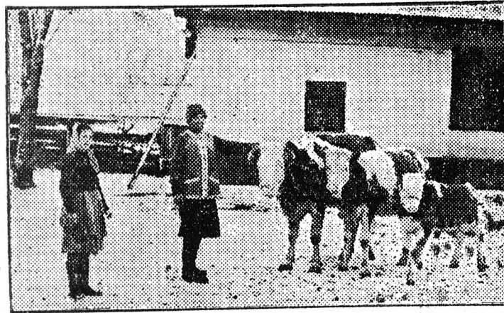
Gombos Imre dereckéi lakos 7 éves piros-tarka „Citrom” nevű tehene, 22 literes, borjaival.