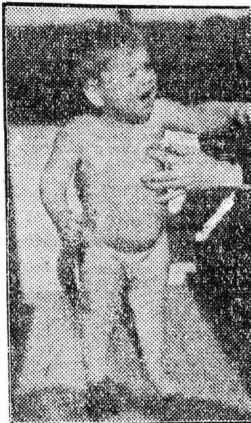
Sorvadt csecsemő a gyógyulás után

— Az eredmények igen kedvezőek. Az egyszerű sorvadt csecsemők mind meggyógyulnak. Még az olyan csecsemők 50 százaléka is gyarapszik súlyban a klíma-osztályon, akiknél a sor-