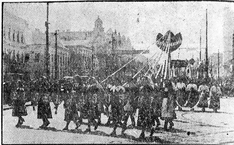
A Gépi-fermentáló dolgozói a most kapott élizem jelvényt vonultak fel.