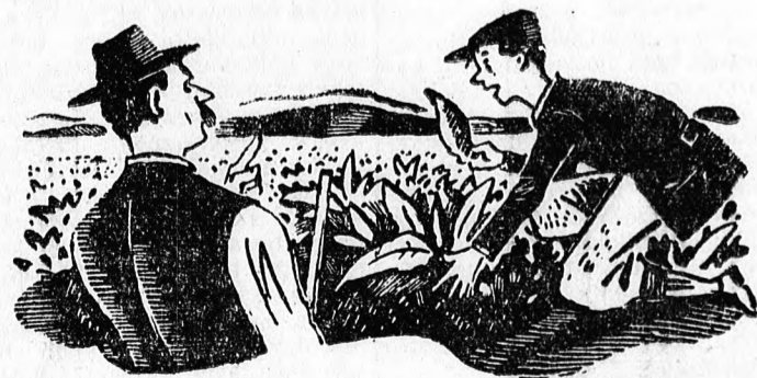
Nézzé, bátyám, ott a mákjárt — Kicsi, rusnya barkók rágják.

ponta több mint félezer liter juhtejet dolgoznak itt fel. Májusban megkezdik a füstölt szalagsajt, a „Paranyica” sajt készítését.