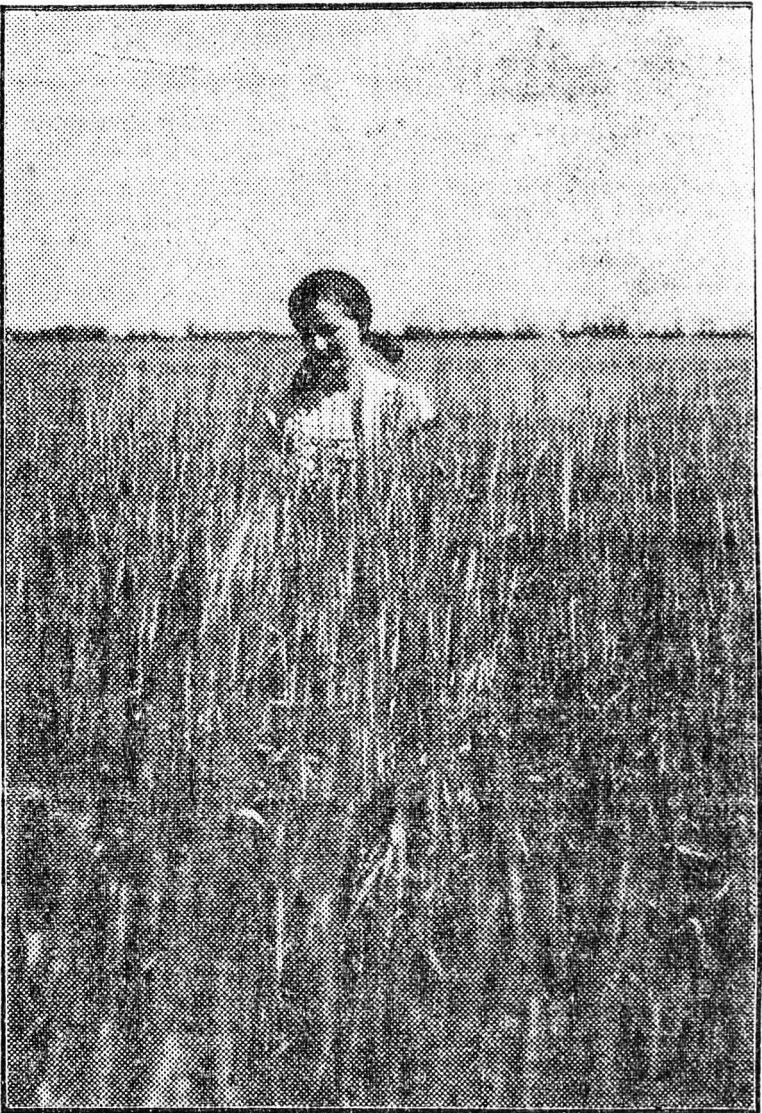
A megye egyik legszebb búzatalajja az ebesi Vörös Csillag földjén érik a kassza alá.

Az eredmények a tagság szorgalmát dicsérik, nincs senki, aki el ne ismerné, derekasan dolgoznak a szövetkezet tagjai.