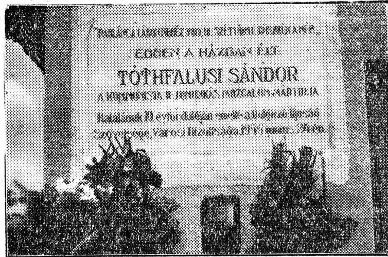
Emléktábla Tóthfalusi Sándor lakóházán.

— Szomorúak, de büszkék is vagyunk rá, — fejezte be beszédét Kulcsár elvtárs — hogy Tóthfalusi elvtárs mártírjára is ott van a szabadság fájának táptalajában. E szabadsággal élni tudtunk eddig is, élni fogunk vele ezután is. Bizonyítjuk, hogy mártírjaink áldozata nem volt hiábavaló, minden ellenséges acsarkodás és árnykodás ellenére győzelmesen felépítjük a dolgozók szocialista Magyarországot!