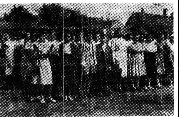
A Közgazdasági Technikum udvarán az elsőök csoportja

A Közgazdasági Techni-kum Kereskedelmi Tagoza-tában az idén más volt a megnyitó, mint bármikor ed-dig. Ez iskola küszöbét — fennállása óta — most elő-ször lépték át fiú-tanulók. Az első évesek közül sokan jöttek kitűnő bizonyítvány-nyal ez iskolába, s mint ezt évnnyitó beszédében Csabina János igazgató is kifejezte, ezt az eredményt fegyelmel-zett és jó tanulással remél-hetőleg meg is tartják. Ko-