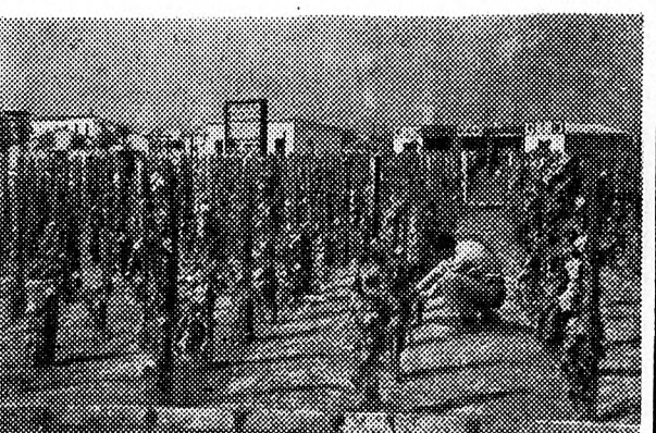
Az Országos Mezőgazdasági Kiállításon igen nagy sikert aratott a telepített szőlő, amelyet a kiállítás előtt ültettek el, és már terem is,