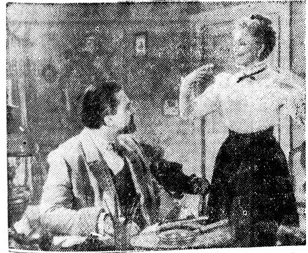
A nagyítóval néz az egyik jelenet.

Az új, kiváló, színes szovjet filmalkotás a csehovi mondanivaló maradáktalan tolmácsolásával és a művészek elősrendű játékával a legjobbak közé sorolható. A léha asszony című filmet Debrecenben a Vig Filmszínház mutatja be, október 16-tól 20-ig.