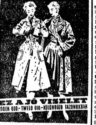
EZ A JO VISELET (LODÉN 600-TWEE 610-KÜLÖNBÖZŐ TÁJZANOKBAN)

A Belkereskedelmi Minisz- térium közölte az üzletek nyitvatartásának rendjét a november 5-7 közötti időben. Az ünnepi nyitvatartás rendjét a megyei tanácsok vb kereske- delmi osztályai szabályozzák. (MTI.)