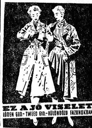
EZ A JÓ VISELET (LÖBEN 600-TWÉD 610-KÜLÖNBÖZŐ FÁZONOKBAN)

A Magyar Dolgozók Pártja Hajdú-Bihar megyei Bizottságának a) Szerkesztő: a szerkesztő bizottság Felelős kiadó: Az MDP Hajdú-Bihar megyei párt-vezetőség bizottsága. Debrecen, Tóthfalusi tér 10. Terjesztő: a Megyei Postahivatal Szabadság Lapnyomda, Debrecen