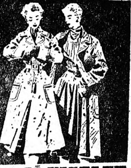
EZ A JO VISELET LŐDÉN GÖD-TWEEÓ GIO-KÜLÖNBÖZŐ FAZONLÓKON

VIG: ma fél 2, fél 4, 6 és negyed 9 órakor; hétfőn fél 4, 6 és negyed 9 órakor; a 9-es körterem. — BEKE: ma negyed 2, fél 4, 6 és negyed 9 órakor; hétfőn fél 4, 6 és negyed 9 órakor; A mi nemzedékünk. Hétfőn délelőtt fél 10, fél 12 és fél 2 órakor; A 9-es körterem. — METEOR: ma és hétfőn fél 3, 5 és negyed 8 órakor; a háromnegyed 2, 4, 6 és 8 órakor; Hétfőn háromnegyed 2, 4, 6 és 8 órakor; Nyári vakáció. — KLINIKAI: ma 3, fél 6 órakor; Viharban nőttek fel, este fél 8 órakor; A mi nemzedékünk. MATINÉ-MUSOROK: VIG: 11 órakor: Budapesti tavasz. — BEKE: 11 órakor: Egy katedra története. — METEOR: 10 órakor: Bátor színdarab. — IFUSAGI: 9 és 11 órakor: Bátor színdarab. Nepnevelő-mozik műsora: Gyógynevelés: Mühlbergi ördög. — Rákosi telep: Főelem bére. — Homokkert II.: Gázolás. — Siketnéma Inlézet: Békében élni. — Kerékes telep: Romeo és Julia. — Nyulás: Békében élni. — Csapókert III.: Veszélyes juvar. — Apaftal: Mühlbergi ördög. — Dózsa Vándor I. Fancsika, hétfőn Mézeshegy: Mágus Miska. — Dózsa Vándor II. ma, Lenin TSZ, hétfőn Lencs telep. — Ádnyókerdő foglyal. — Dózsa Vándor III. ma Csere, Vörös Csillag TSZ., hétfőn Dombostanya: Vidám verseny.