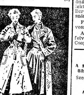
EZ A JÓ VISELET LOREN GÖC-TWED SIO-KULHÖRÖZŐ TÁRSASÁG

ERTESETTI a tanácsigazgató az érdekelteket, hogy az aratásban résztvevők feladagja megkezdett. Az utalvány 10 napon belül a gazdaság iródjában befizetés ellenében átvethető.