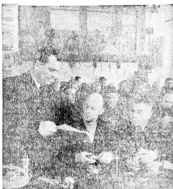
A Szovjetunió számos kerületéből érkeztek kolhozelnökök a moszkvai „K. A. Tyimirjasev” mezőgazdasági akadémia tanfolyamaira.

Az akadémia szaktanfolyamain marxizmus-leninizmus, matematika, kémia, fizika és orosz nyelv tanulása mellett földműveléssel, állattenyésztéssel, növénytermesztéssel és rétműveléssel foglalkoznak. A tanfolyamok hallgatói tanulmányozzák a kolhoztermelés megszervezését, megismerkednek az új mezőgazdasági gépekkel.