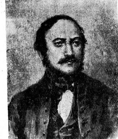
Kard, eke, lánccsészle a vassnak gazdag eréből: Tápilát, véd, bírtet, hármosan őrzi a hont.

MAI OLVASÓ ha szédülten beleme-redez Vörösmarty alkotásainak ha-lalós érvényeibe: meg kell az ő vívdá-sait értened. Mi változott a magyarság