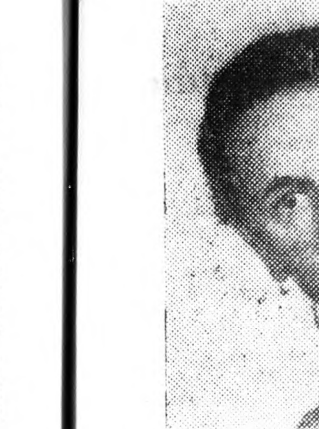
GALL M. a tiszagyalahat TSZ tagja. Év szeres levelezőnek. Leveléibe termelőszövetkezménye...