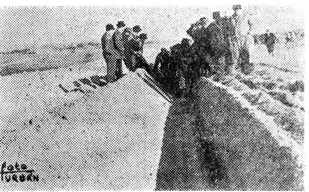
Aljtrágyázásra elkészített barázda.