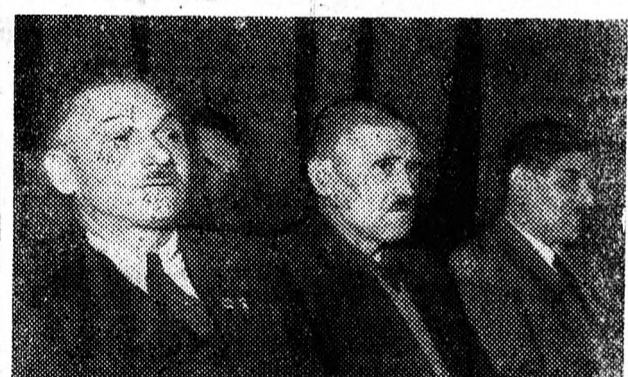
A Járműjavító dolgozói a levelező tanácskozáson

ciusi és az ezt követő határozatok szabják meg. Megyénkben a minisztériumi vállalatok az első 3 negyedévében jó eredményeket értek el, a mezőgazdaságban is összehasonlíthatatlanul magasabb a terméseredmény, mint az elmúlt években. A mi termelőszövetkezeink ebben az évben fényesen bizonyították a nagyüzemi gazdálkodás fölényét az egyéni gazdasággal szemben. A termelőszövetkezetek 18-20 mázsa átlag gabonatermetést értek el, ami jóval felülmúlja az egyéni dolgozó parasztok gabonatermésének eredményét. A megyénk ellátásának megjavítása érdekében csak Debrecenben jelenleg 36 ezer disznó hizik. Sertések száma a megyében a felszabadulás óta most a legmagasabb. Ennek ellenére megis zavarok voltak az ellátás terén, mert állandóan növekszenek az igények. Azért szocializmus a szo-