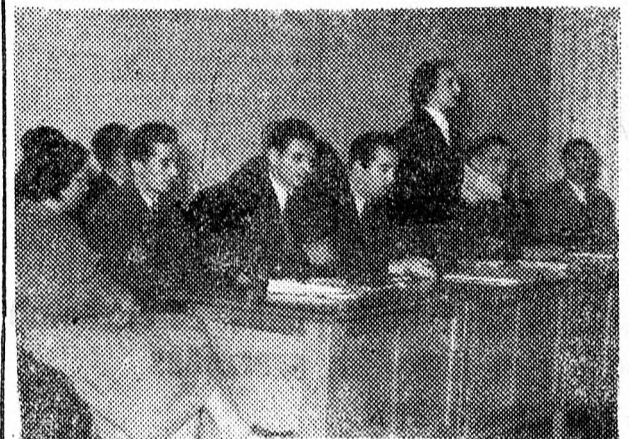
A tanácskozás elnöksége

Vasárnap egésznapos tanácskozásra gyűltek össze a Hajdú-Bihar megyei Néplap levelezői, hogy megbeszéljék azokat a feladatokat, amelyek a Központi Vezetőség határozata nyomán eléltük állnak: eredmények közlésével, bírálatokkal segítsék a második öt éves terv sikeres indulását, harcoljanak a tervek maradéktalan teljesítéséért, a mezőgazdaság szocialista átszervezéséért, terméshozamok emeléséért.