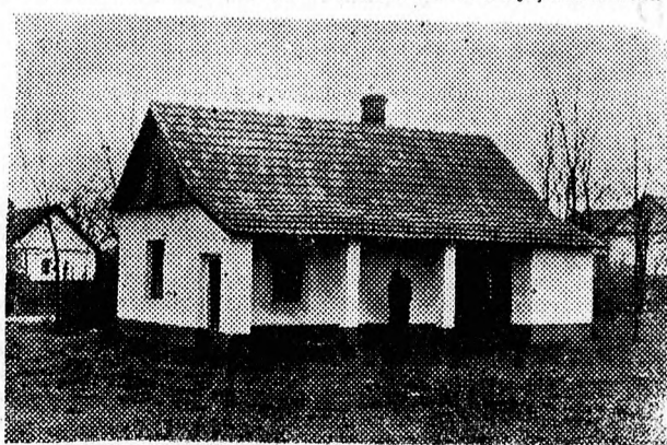
A fiatal házaspár az új ház környékét csinosítja

je a felsorolást, amny mindenre felt a jövedelemből. — Ugy általában, a család minden tagjának jutott két öltöny ruha, csizma, meg egy csomó fehérnemű. En hazat kaptam. — A család egy évi keresetéből meg háza is felt? — Hát persze — mosolyog. — Nemrég nősültem, 15 ezer forintért új hazat építettünk. A másik is készülőben van már az öcsém részére, aki most ugyan katona, de mire leszrel, szüksége lesz a háza. A fa- és cserépanyagot már megvettük a másik házhoz, s tavasszal hozzákezdünk a felépítéséhez, mert még van felesleges termény, abból futja. — Ott van az Új Világ Termelőszövetkezethez közel az új ház, elmegyünk, megnézzük, Takaros kis porta, szoba, konyha, kamrás lakás. A berendezése is egyszerű, de csinos. — Mit szólnak a kívülállók? — Azt mondják, hogy könyvnyű nekünk, sokan dolgoznak. De sokan is eszünk.