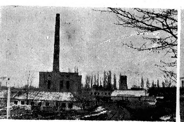
Befejezés előtt áll a Berettyóújfalui Tejkombinát építése. A több millió forint költséggel épülő üzem felszerelésével május elejére készülnek el teljesen.