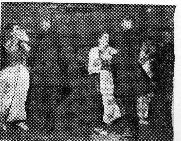
Környagot Táncolják a Debreceni Népi Együttes tagjai