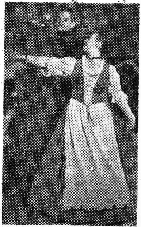
Ez a pár olyan szépen és oly izlésezen táncolt, hogy külön megörökitette fényképészüink.