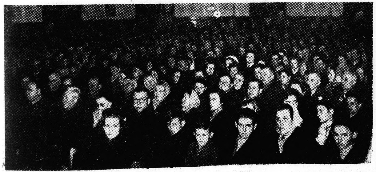
A felszabadulási ünnepség hallgatóságának egy része

Kedden megkoszorúzták a gellérthegy-i szovjet emlékművet is.