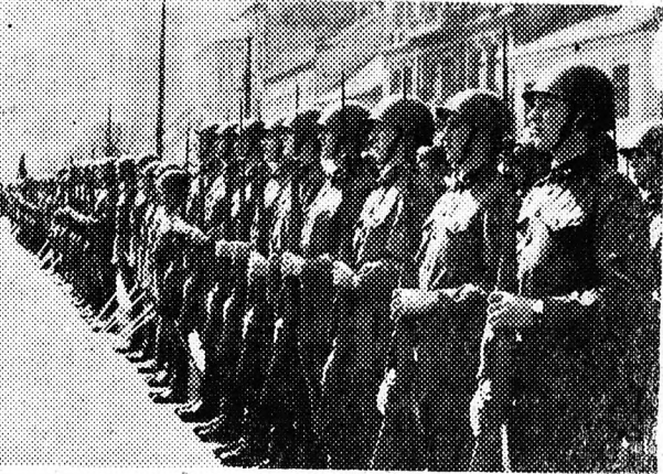
A díszmenetben részt vett katonai egység egyik csoportja.

kulatai díszmenetben vonultak el a koszorúktól ékes emlékmű és a megjelentek előtt. Ugyancsak szerdán délelőtt rendezte felszabadulási ünnepét a Csokonai Gimnázium DISZ szervezete és tantszűlet. Debrecen legnagyobb középiskolájában közel 1000 diák gyűlt össze, hogy együtt és közösen ünnepeljék felszabadulásunk évfordulóját. Este 7 órakor a Csokonai Színház művészei rendeztek felszabadulási emlékűnnep-séget. Erkel: Bánk bán című operáját mutatták be kiváló tolmácsolásban. A színház tagjai nemzeti operánk felújításával köszöntötték április 4-ét. Az opera bemutatása hatalmas sikert aratott. Különösen kiváló alakítást nyújtott Hámory Imre Petur, Lothár Miklós Bánk bán, Bán Ibolya Melinda, Virágos Mihály Tibor, Oswald Gyula Ottó, Kerekes Gábor Biberach és Nagy Béla II. Endre szerepében.