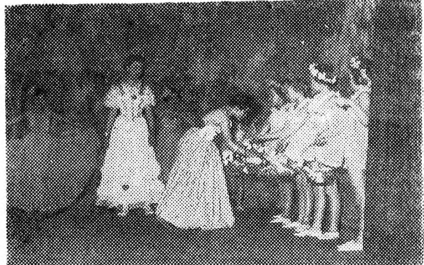
Részlet a Könyvsepecske című mesejátékából

★ A lányoknál még nagyobb a probléma. A Zrínyi Ilona leánynevelő intézet igazgatójával beszélgettünk erről a napokban. Ötvennyolc kislány lakik az intézetben. Ezek a gyerekek vagy más gyermekotthonból, vagy