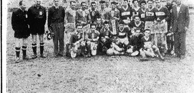
A Nagyvárad-rajon—Berettyóújfalui labdarúgó-mérkőzés részvevői az átépítés alatt levő Progressul pályán.

Most honfitájk meg az indiákat igaz sportágát, a gyepblabdát. Várakodunk kétféle csapat van már, a Dinamo és a Metallo. Vasárnap megtekintettük a Nagyvárad Di-