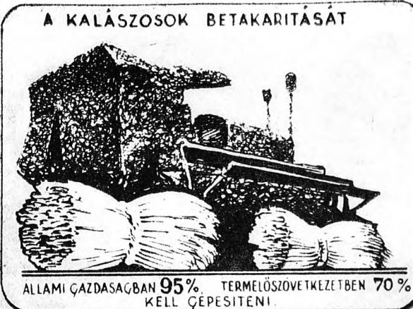
A KALÁSZOSOK BETAKARITÁSÁT ALLAMI GAZDASÁGBAN 95% TERMELŐSZÖVETKEZETBEN 70% KELL GÉPESÍTENI

A kalászosok betakarítását az állami gazdaságokban 95 százalékra kell gépesíteni. Az 1956-60-as években együttvére több mint 3800 arató-cseplőgépet, több mint 1400 kéveket-aratógépet, több mint 6000 kukorica kombájt és silókombájt, mintegy 1500 darab cukorrépa kombájt, jelentős számú burgonyajuttató és burgonyabetakarító gépet kell a mezőgazdaság rendelkezésére bocsátani.