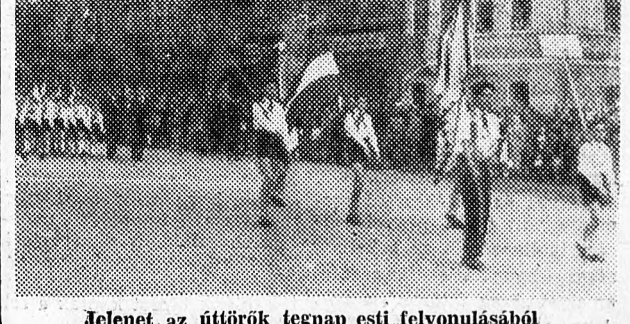
Jelenet az úttörők tegnapi esti felvonásából

A Minisztertanács megállapította a Minisztertanács határozata (Folytatása a 2. oldalon)