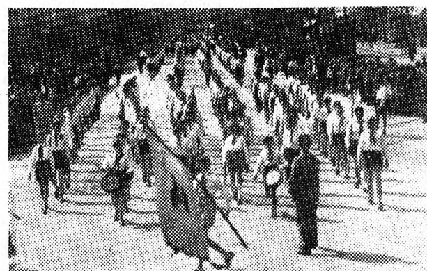
Úttörő díszszázad az ifjúság ünnepi felvonulásán

A pihenni vágyók tüdőtöltés találtak a zöld gyepon, ahol erőt gyűjtöttek a további szórakozáshoz. Újult erővel, fel-frissülve töltötték el a III. megyei ifjúsági találkozó határalevő óráit a megye fiataljai, amelyet ugyan a nem várt tüdőtüzhöz és szórakozáshoz is komoly értéket képviselnek. Amíg a kultúrsoportok, köcsrusok, szavaltok kedvelői a nagyerdői Szabadtéri Színpadon fellépő vidéki kultúrgárdák bemutatójában gyönyör-