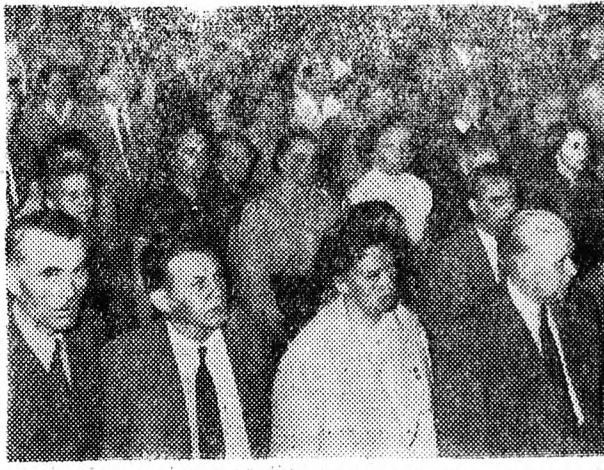
A debreceni pedagógusok egyik csoportja a Központi Kultúrotthonban tartott ünnepségen

A Kossuth Lajos Általános Iskolában az órákői szünetekben összegyűjtve, sutogva tárgyalták a gyermekek. Ha egy-egy nevelő arra haladt, még halkabba fogták szavukat. Csak egyes szavakat lehetett elkapni — tanítónéni, virágok, köszöntés. Megkérdeztük az egyik csoport hangulóját, miért ez a nagy izgalom, Elárulta. A táblán díszes felirat várta tegnap, szombaton reggel az osztályba lépő nevelőt, a legjobb írású tanuló vetette a betűket a táblára. Verset is mondtak köztől — kiosztották a feladatot a legjobb versmondónak, azt hallottuk gyönyörű tarka virágokban sem volt hiány.