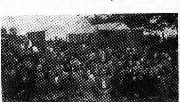
A meghívott tsz-tagok és dolgozó parasztek együtt hallgatták a traktorosokkal a magyar néphadsereg Vörös Csillag Erdemrenddel kitüntetett művezetőinek beszédét

A gépállomás udvarán felállított nagy sátrakban, s a színpadon ebéd volt ezután, ahol vidám hangulatban, jókedvvel ünnepelték a traktorosokat, s a környék dolgozóit a harmadik traktorosnapot. A kora délutáni órákban a néphadsereg Vörös Csillag Erdemrenddel kitüntetett mű-