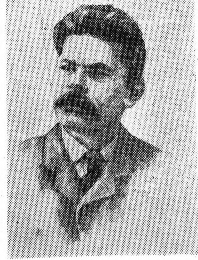
látja Gorkij „kivételes jelentőségét”, hogy „ő a proletariátus első nagy írója, hogy benne ez az osztály... először tudatosítja magát művészként”. Gorkij művészi nagysága nem választható el emberi nagyságától. Ez az emberi nagyság persze úgy értendő, hogy ő maga is ember volt, sok másokra is jellemző hibával, gyengeséggel; előfordult vele, hogy ingadozott, politikai kérdéseket is. De ez csak azért történt, mert nem fogadott el mindent vizsgálóan, kritikátlanul. Gorkijnak a burzsoá nyugaton való népszerűségét egyesek azzal igyekeznek magyarázni, hogy az író sohasem fordított össze a szovjet hatalommal, nem azonosította magát vele teljesen. A valóságban a burzsoázia, amely egyébként is hajlamos a művészt a politikustól elválasztani, egyáltalán nem azt értékelte benne, amit ő maga akar mondani, — Szemléletes példája ennek az Éjjeli