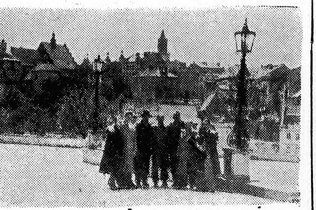
Debrecen Város Tanácsa küldöttsége és Lublin Város Néptanácsa képviselői az Óváros egyik terén.