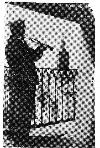
Egy 600 éves szokás Lublinban: az un. krakkói kapu bástyájának erkélyén fúj a strázsá, jelezve, hogy a városi tanács ébren ügyel a lakosságra.

Debrecen Város Tanácsa végrehajtó bizottságának elnöke ezután arról a méretetlen hagyománytiszteltől nyilat-