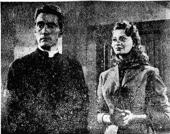
Egy nap a bíróságon

A világ egyik legnagyobb festője születésének 350. évfordulója alkalmából tűzük műsorokra a mozik: a művész életéről készült filmet. Rembrandt szerepében a neves színész, Charles Laughton látjuk. A filmet a nemrég elhunyt világhírű, magyar származású Korda Sándor rendezte.