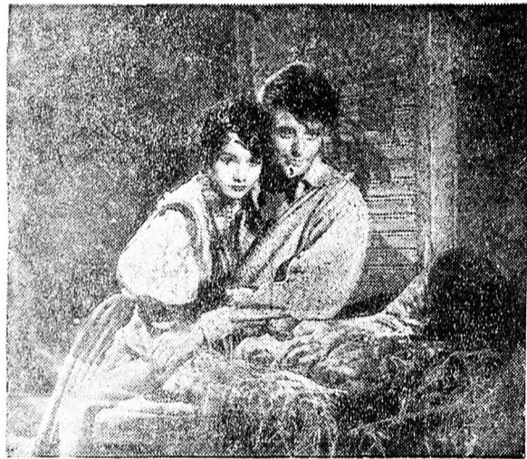
Az ördög szépsége

című filmet jelenleg most játsszák a debreceni mozik. Ez a német-svéd közös film a XVII. század Párizsába vezeti a nézőt. XIV. Lajos korába. Abban az időben, főleg a fővárosban napirenden voltak a gyilkosságok, merénylések. Ez a film egy érdekes bűnügyi történetet dolgoz fel. A film forgatókönyve E. T. A. Hoffmann novellájából készült, aki egyike a német romantika legjelentősebb költőinek. Egyik legismertebb műve a Scuderi kisasszony. A főhős, Cardillac aranyműves megismerkedik Willy A. Kleinau nem ismeretlen a magyar közönség előtt. Szerepelt többek között a Veszelés fuvár, a Mühlenbergi ördög című filmekben. Scuderi kisasszonyt Henny Forten alakítja, aki a régi, nagynevű színésznőnek egyik tagja. Hosszú ideig nem szerepelt filmen. Legutóbb a 3 Lambert-ben játszott.