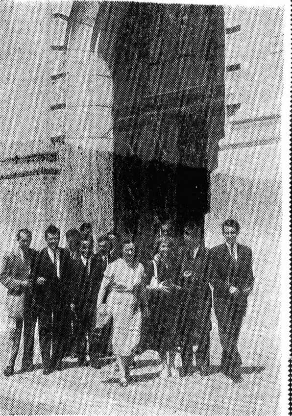
Az új diplomás fiatalok elhagyják az egyetemet.

Vasárnap délelőtt a debre- ceni Kossuth Lajos Tuda- mányegyetem aulájában ünne- pélyesen adták át a végző hall- gatóknak a diplomákat. Te- gnap délután szüfölgés töltötték meg az érdeklődők, a végzett hall- gatók hozzátartozói.