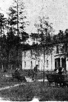
Részlet a Kadzierzyna-i új lakónegyedből

De nem sokkal kedvezőbb képet mutatnak más lengyel városok sem. Sok más lengyel