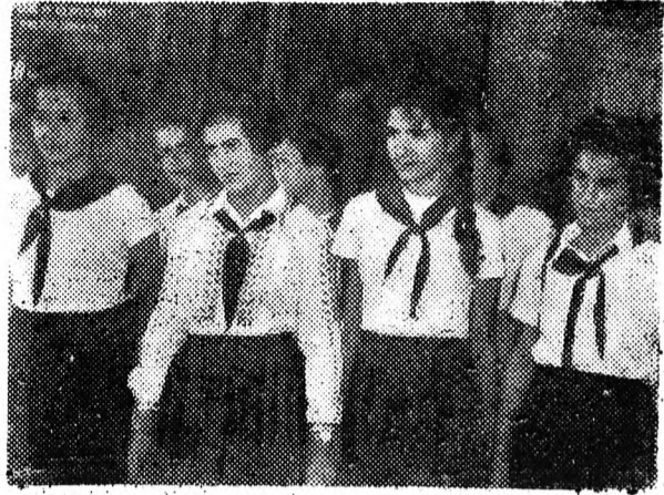
A bolgár úttörők egy csoportja.