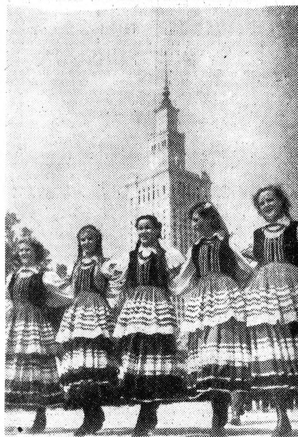
Lengyel lányok a Kultúrpalota előtt