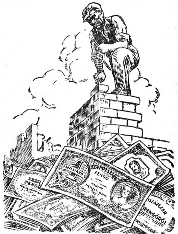
Az infláció még dühöngött de a párt szavára a munkások megfogták a kalapács nyelét. Korgó gyomorral, lerongyolódva, de bizó lütel álltak munkába. Munkájukat siker koronázza.

Banktisztviselők kevesen számoltak olyan nagy számmal, mint az infláció utolsó heteiben, 1946. június, július hónapban. A Néplap 1946. július 2-i számán még ez állott: ára: 100 billió. Egy hét múlva? Ára: 500 ezer billió, újabb egy hét, ára: 270 trillió. Ki számolta ekkor a pénzeket? Szinre, vagy súlyra, csomóra mérték a pénzt. Nagy csomó pénzért fél marék lisztet, vagy babot adtak a piacon. A stabilizáció után megjelent egy táblázat, mely megkönnyíti a pengőadósságok átszámítását forintba. E táblázat szerint egy billió pengő 1946. június 19-én egyenlő 1,02 forinttal. De ez is csak hivatalos átszámítási kulcs volt. Egy billió a valóságban nem ért annyit, mint amennyit a hivatalos vásárló értéke lett volna. Számtan-gerben úszott az ország, melyből úgy látszott nincs kivétező út, nincs rév, nincs part, csak elmerülés az inflációs hullámokban.