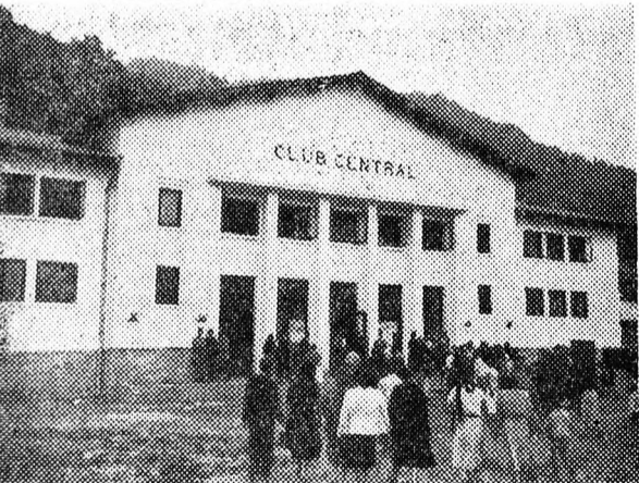
A bicazi erőmű központi klubja,