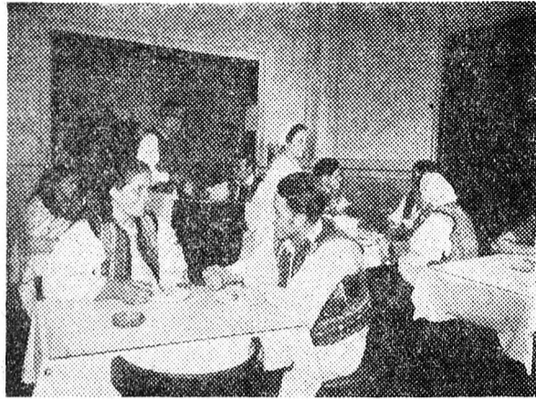
Néha a cukrászdai sitemények jobban esnek, mint az otthon készülték. A Nagyványa vidéki Borsa közég fiataljainak úgy látszik, ez a véleménye