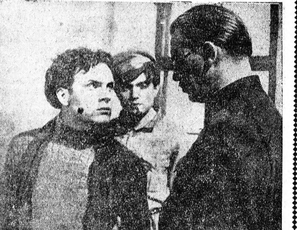
Jelenet az új ember kovácsa című filmből

Az operakérdővel újra láthatunk egy igazi olasz operafilmet, Verdi Traviatájából készült alkotást. A filmet az olasz opera minden erényével és az olasz operaszínpad legkiválóbb művészeivel — többek között Tito Gobbi val is találkozunk