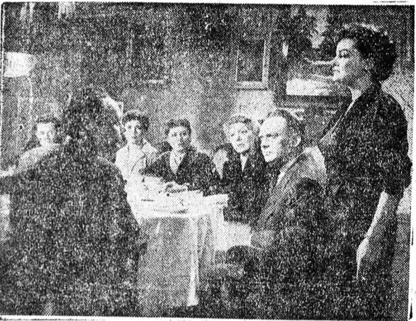
Jelenet az Ünnepi vacsora című filmből

Szeptemberben a legnagyobb filmbemutatónak a szovjet filmgyártás alkotása, az Othello ígérkezik. Shakespeare halhatatlan alkotása, melynek főszerepét Bondarcsuk , a hazánkban ismert filmszínész alakítja, a cannesi filmfesztiválon a rendezés nagydíját nyerte. A filmet a magyar hangokat a Nemzeti Színház kiváló művészei, az Othello magyar alakítói, élükön Bessenyei Ferenc Kossuth-díjossal, szálaltatják meg. A kiváló filmalkotást a Béke Filmszínház mutatja be