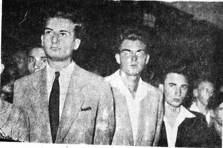
Az elsőévesek egy csoportja