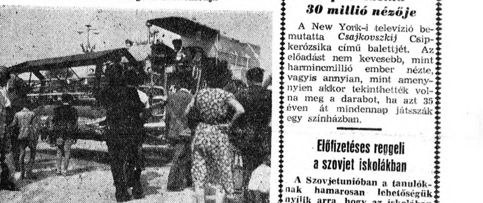
Az ezüst kombájn már bálába köti a szalmát