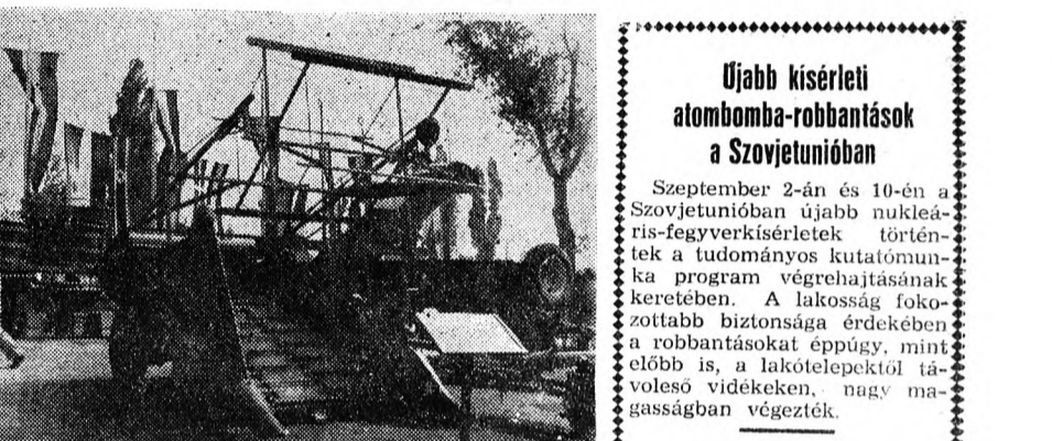
A géppark érdekesége a silókombájn